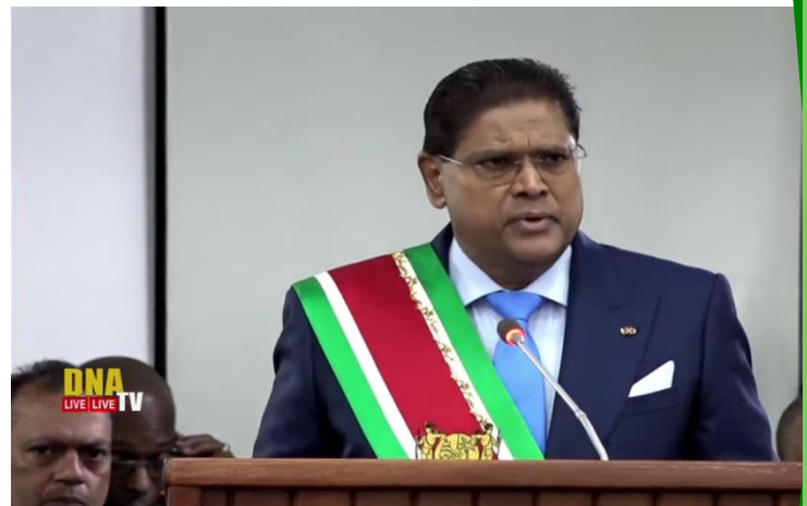
President C. Santokhi tijdens de jaarrede

De VES vindt het begrotingstekort economisch onverantwoord. Het voornemen van de Regering om te streven naar begrotingsevenwicht blijken wederom mooie woorden te zijn, die niet kloppen met de realiteit. Het hebben van een begrotingstekort van 11,1% legt een bom onder de staatsfinanciën en draagt bij aan diverse onevenwichtigheden in onze economie, zoals verdere stijging van de wisselkoers en verdere ontwaarding van de SRD en daarmee gepaard gaande toenemende armoede.