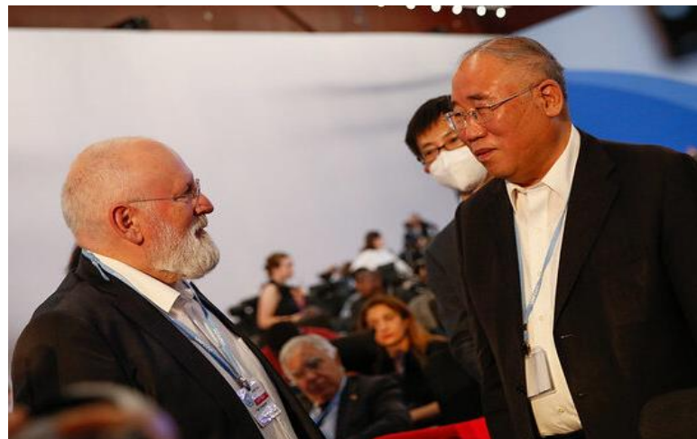
EU-vicevoorzitter Frans Timmermans en China's klimaatgezant Xie Zhenhua

Ontwikkelingslanden, w.o. ook de Caricom onder leiding van de voorzitter C.Santokhi, hebben zich sterk gemaakt om een speciaal schadefonds te krijgen. De EU ging als eerste overstag om een fonds te steunen onder voorwaarde dat de donorbasis zou worden uitgebreid, het gericht zou zijn op de meest kwetsbare ontwikkelingslanden en als Cop27 ook zou instemmen met krachtige actie om de uitstoot te verminderen. Aan deze voorwaarden werd gedeeltelijk voldaan en ontwikkelingslanden accepteerden het aanbod. De VS en andere rijke landen stapten uiteindelijk ook aan boord.