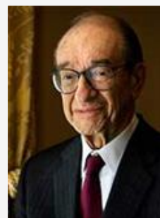
Amerikaanse Centrale Bank President 1987 - 2006 Alan Greenspan

“Over het algemeen, corruptie steekt de kop op wanneer overheden gunsten kunnen leveren, of iets kunnen verkopen.”