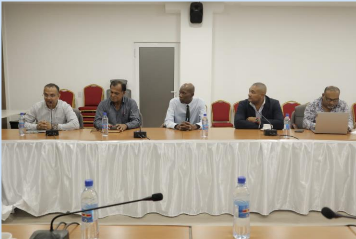
VES meeting met de President

Met dit uitgangspunt is er een basis waarop de VES-ondersteuning kan bieden op de gebieden waar de Regering niet goed presteert en aangeeft de hulp van de VES op prijs te stellen. Deze meeting is op donderdag 1 december op technisch niveau voortgezet op het Ministerie van Financiën. Afsproken is dat de vervolgbespreking weer op Presidentieel niveau gaat plaatsvinden. Daarbij zullen afspraken worden gemaakt over de werkwijze, waarbij de VES een duidelijk mandaat krijgt van de President o.a. over toegang tot alle beschikbare informatie en data (level playing field). De VES gaat voor "totaal voetbal" waarbij de samenwerking alleen duurzaam zal zijn binnen een kader van volledige transparantie en het uitblijven/bestrijden van bestuurlijke excessen en buitensporigheden zoals het benoemen en bevoordelen van friends, family, sponsors en loyalisten. Dit kan alleen in een situatie van politieke stabiliteit, anders a nai woko....!