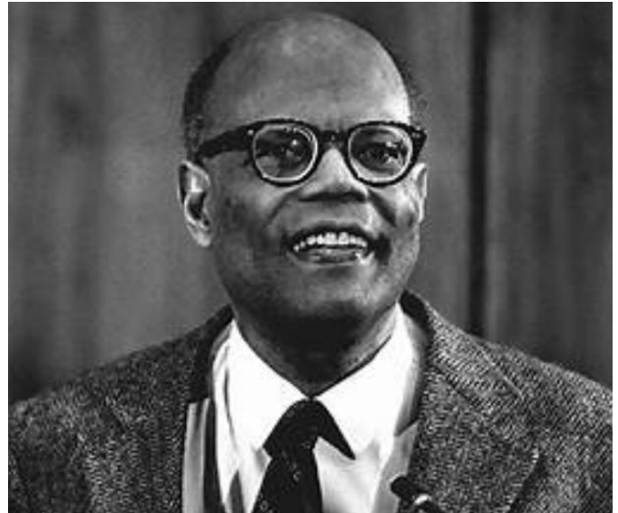
Nobelprijswinnaar Arthur Lewis

Deze industrialisatie-theorie is betoogd door de Brits-Jamaicaanse Nobelprijswinnaar Arthur Lewis (1954) en die was gebaseerd op een ‘unlimited supply of labourers’ (de aanvoer uit de landbouw) die op subsistentie niveau leefde. Dit beleid is praktisch overal in het Caraïbisch gebied mislukt.