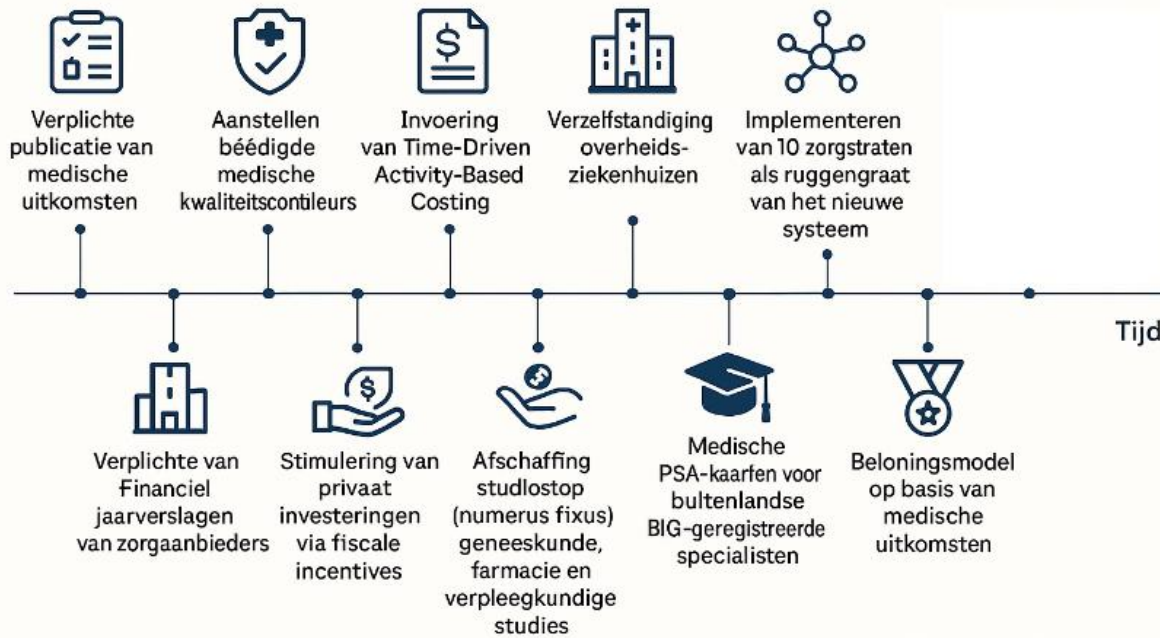
Tekst bij figuur: VES Stappenplan