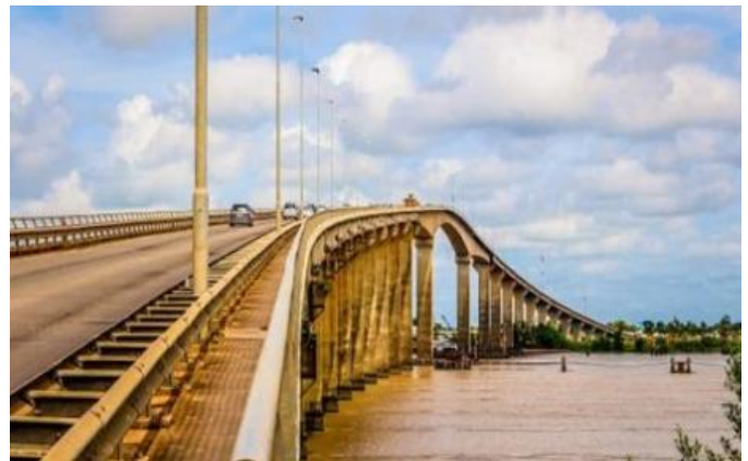
Over de Surinamerivier : de tweede Wijdensboschbrug

Minder dan een jaar daarop kon de brug nabij Paramaribo nog net voor de verkiezingen van mei 2020 worden opengesteld. Met aan beide kanten van deze brug meer dan levensgroot het portret van de "Man of Action" die dit huzarenstukje voor mekaar had gekregen, of dat in elk geval op zijn naam wilde schrijven. Bij de opening van de brug over de Surinamerivier in mei 2000 hield Wijdenbosch de bevolking voor dat dit een brug was voor iedereen, een brug die was gebouwd dankzij de offers van het volk en dus niet de verworvenheid was van één man alleen. Maar enkele minuten later onthulde hij een plaquette waarop de naam van de brug bekend werd gemaakt: de drs. J. A. Wijdenboschbrug , de tweede met die naam dus na de brug nabij Boskamp. Een groot deel van de Surinaamse media veegde na de opening van de brug de vloer aan met Wijdenbosch, omdat hij het bouwwerk zijn eigen naam heeft gegeven. "De reinste vorm van zelfverheerlijking", schreef De Ware Tijd in zijn commentaar.