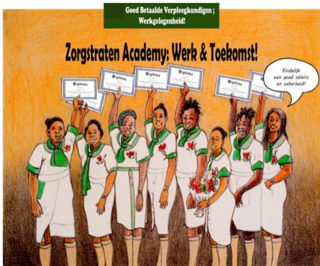
(Tekst bij kunsttekening: medische zorgstraat creëert kwaliteit voor de patiënten en hoogwaardige werkgelegenheid voor personeel).

Samen vertegenwoordigen deze drie aandoeningen meer dan 60.000 patiënten, vaak met meervoudige problematiek. Dat maakt Wanica bij uitstek geschikt voor een geïntegreerde aanpak via zorgstraten, zoals door de VES bepleit. In het huidige zorgmodel worden patiënten met chronische ziekten langs losse schakels gestuurd: huisarts, poli, ziekenhuis, apotheek, soms zonder samenhang. De VES stelt daar een ander model tegenover: zorgstraten waarin preventie, diagnostiek, behandeling en nazorg per ziektebeeld zijn geïntegreerd. Voor Wanica betekent dit: een diabeteszorgstraat (screening, medicatie, leefstijl, complicatiezorg), een cardiovasculaire zorgstraat (hypertensie, hartfalen, secundaire preventie), een nierzorgstraat (vroegdiagnostiek, dialysevoorbereiding, nefrologische follow-up).