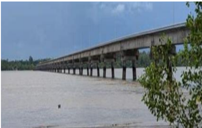
Over de Saramaccarivier : de eerste Wijdensboschbrug

Wat Nederland voor ons niet had gedaan zouden we zelf en beter doen. Al snel in het voorjaar van 1997 werd aan het Nederlandse Ballast Nedam onderhands de opdracht gegund om voor 170 miljoen Nederlandse gulden 2 grote bruggen te bouwen. De eerste hiervan, de brug nabij Coppenamepunt kon reeds op 1 juli 1999 in gebruik worden genomen. Volgens Surinamenieuwscentrale werd deze 1.500 meter lange brug een dag na de opening in 1999 omgedoopt tot Wijdenboschbrug , maar na alle kritiek die hierop ontstond werd het naambord snel verwijderd.